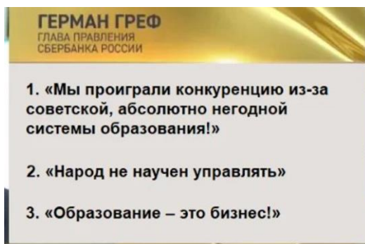
Рис. 2. Три высказывания Грефа, ставшие широко известными

Чрезвычайно актуальным для понимания опасности тотальной и некритической цифровизации российского образования является