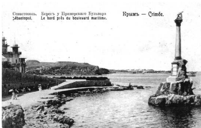
Рис. 5 Памятник затопленным кораблям