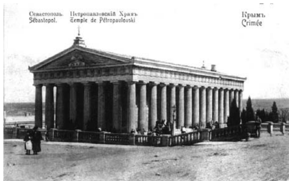
Рис. 6 Храм св. апостолов Петра и Павла

цом 1 гильдии С.Л. Кундышевым-Володиным, храм св. апостолов Петра и Павла (рис.6), старостой которого одно время являлся [2].