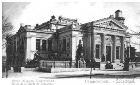
Рис. 3 Военно-морской Музей