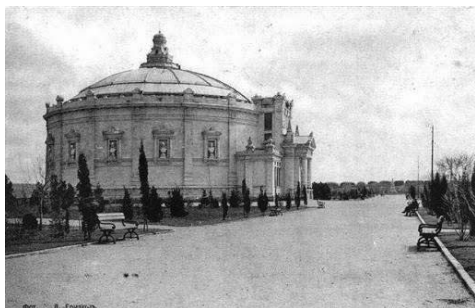
Рис. 4 Музей панорама «Оборона Севастополя 1854–1855 гг.»

мя его правления до неузнаваемости меняется архитектурный облик Севастополя (помимо вышеупомянутых объектов, можно назвать: музей-панорама «Оборона Севастополя 1854–1855 годов» (рис. 4), Памятник затопленным кораблям (рис. 5), Покровский собор и др.), развивается городская экономика, медицина, образование, культура.