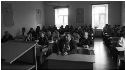
Научно-практическая конференция «Практические аспекты духовно-нравственного воспитания в системе современного образования» в Крымском республиканском институте постдипломного педагогического образования (г. Симферополь)