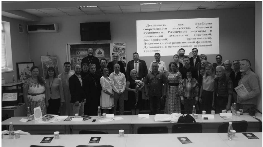
Научно-практическая конференция «Ресурс теологии в совершенствовании государственно-конфессиональных отношений» (г. Севастополь)