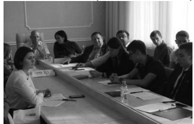
Научно-практическая конференция «Правовая грамотность и духовное самосознание: свобода и ответственность» в Крымском юридическом институте (филиале) Университета прокуратуры Российской Федерации (г. Симферополь)