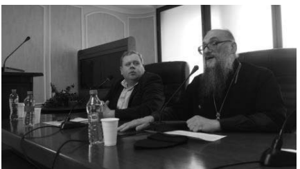
Научная конференция «Крым, Православие, Славянство: духовно-исторические проекции». в Крымском федеральном университете имени В.И. Вернадского (г. Симферополь).