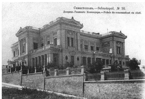
Рис.2 Дом Главного командира императорского Черноморского флота