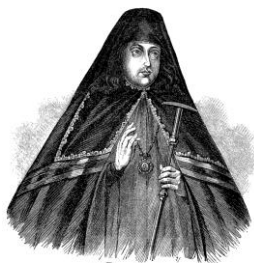
Преподобный Афанасий Сретенский Холмогорский Введенский.

Один из исследовательских проектов, в котором приняли участие молодые исследователи, был посвящен 350-летию Петра Первого. В честь юбилея и в память о российском царе было опубликовано немало информации, но малоизвестным оказался его вклад в развитие медицины, в т.ч. его сотрудничество с Афанасием Холмогорским – первым архиепископом Холмогорским и Важским. Он создал и обустроил Архангельскую епархию, был дальновидным религиозным и политическим деятелем, писал духовные и светские книги, прославился как один из просвещенных людей Севера. Он оставил след как крупный грамотный врачеватель земли Холмогорской [7].