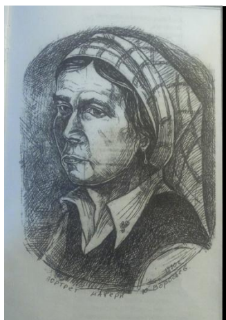
(портрет матери, 1990 г.)