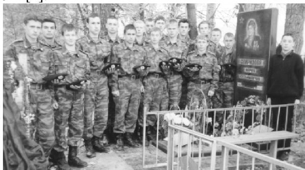
Рис. 2 На могиле знаменитой пулеметчицы

Ведь нравственному развитию может способствовать хорошо организованная совместная учебная и трудовая деятельность [2].