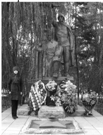
Рис. 5 Памятник неизвестному солдату (с. Доброе)

Это – самые обычные люди, но даже в сложной, страшной обстановке они не потеряли себя как людей, они сохранили мораль, сберегли Родину и будущие поколения. Они победили фашизм – великое мировое зло. Они не «бэтмены» и «супермены», которые популярны сегодня в качестве суррогатных героев. Они – истинные герои.