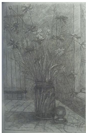
(иллюстрация к рассказу "Один летний день")