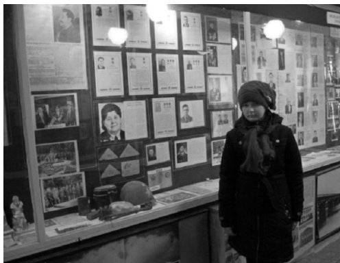
Рис. 4 В стенах Добровского краеведческого музея